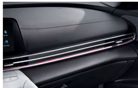
Интерьерная подсветка салона (64 цвета)