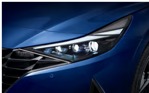
Светодиодные передние фары