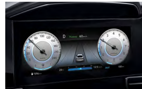
Цифровая приборная панель с диагональю 10,25"