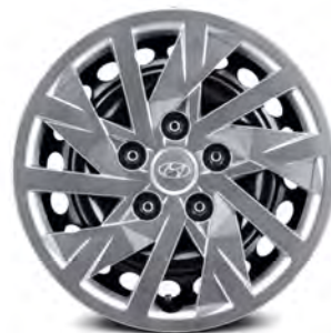
15-дюймовые стальные колёсные диски и колпаки