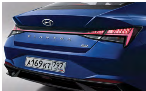
Задние светодиодные комбинированные фонари