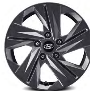
16-дюймовые легкосплавные диски