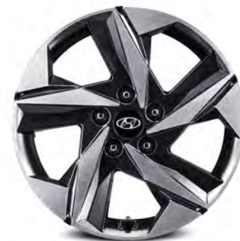
17-дюймовые легкосплавные диски