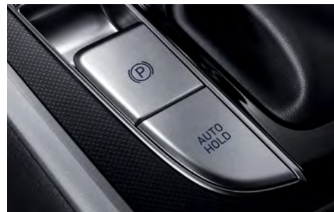
Электронный стояночный тормоз с режимом автоматического удержания (EPB)