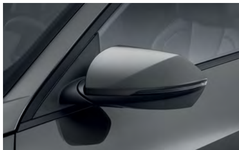
Электропривод складывания наружных зеркал