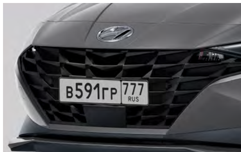
Чёрная решётка радиатора