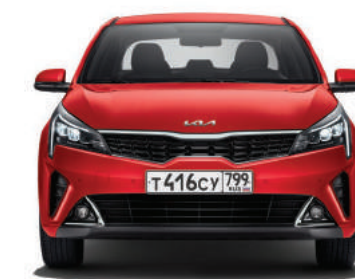
1 740 мм