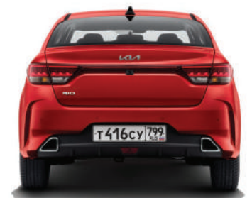
1 470 мм